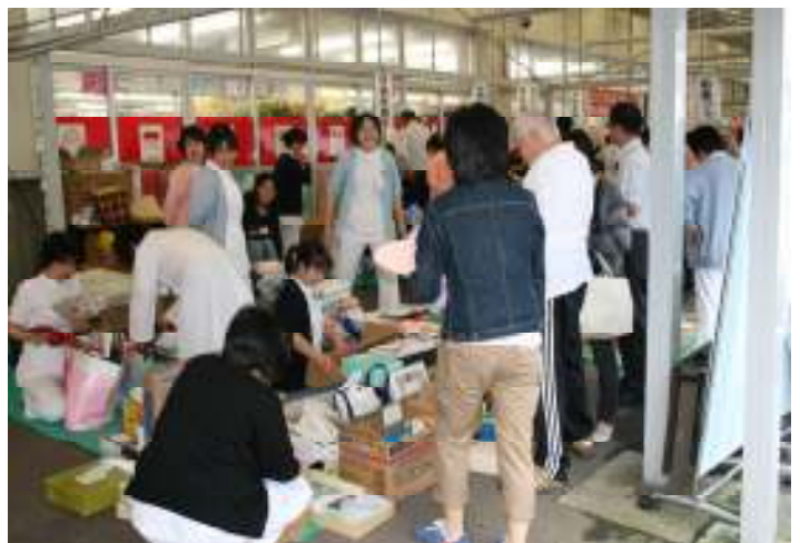
(ミニフリーマーケットの様子)

身長体重測定・血管年齢測定をはじめ、骨強度測定・体脂肪測定・AED講習・健康相談など各ブースに多くの方が来場されました。特にAED講習のブースでは、皆様、真剣に講習を受けておられました。