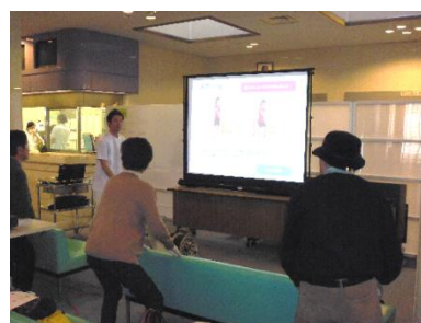
転倒予防体操の様子