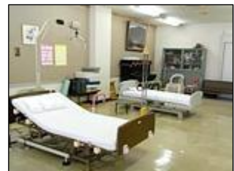
日常生活動作訓練室