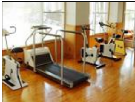
フィットネスルーム